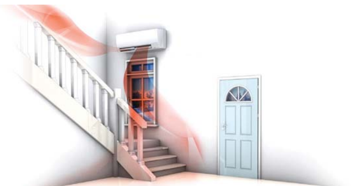
Kirigamine MSZ-FH tagab majas parema soojuse jaotumise

Mitsubishi Electricu soojuspumbad on tuntud madala mürataseme poolest. Ka Kirigamine MSZ-FH ei ole erand, siseosa müratase on vaid 20 dB(A).