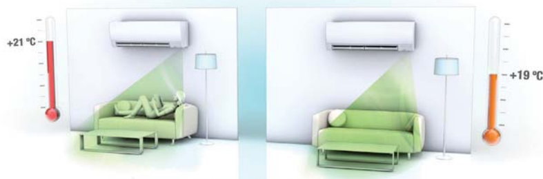
Inimese kohalolu tuvastav andur (Human Sensor) vähendab küttekulusid

Kogu uurimistöö, tootarendus ja tootmine toimub Mitsubishi Electricu laborites ning tehastes. See kindlustab kõigile toodetele kõrge kvaliteedi ja töökindluse. Tagamaks kogu tootja ja tarbija vahelise